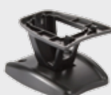
• 11-0114 可倾斜调整的展位支架和固定安装孔, 灰色, 6.0厘米/ 2.4寸